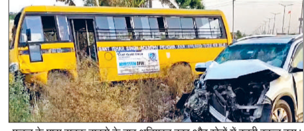
फरल के पास सड़क हादसे के बाद क्षतिग्रस्त कार और खेतों में उतरी स्कूल बस।