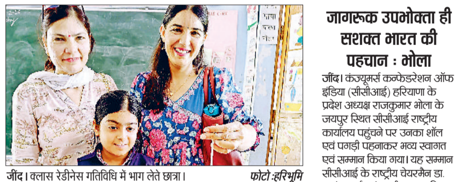
जौदा। क्लास रेडीनेस गतिविधि में भाग लेते छात्र।