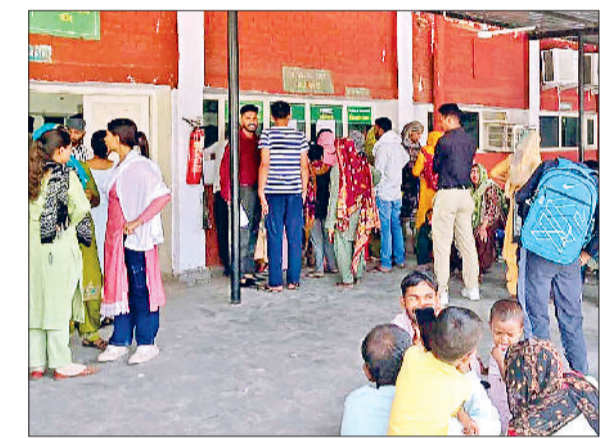
नागरिक अस्पताल स्थित लेब से अपनी जांच रिपोर्ट लेते हुए मरीज।

सूर्य देवता ने आग उगल दी है और पारा उफान की तरफ है। जिसका जनजीवन पर साफ असर देखने को मिल रहा है। दोपहर को बाजार तथा सड़कें सुनसान हो रहीं हैं और हालात कफ़ू जैसे दिखाई दे रहे हैं। उलटी, दस्त तथा सिर चकराने के मामलों में भी इजाफा हुआ है। मंगलवार को अधिकतम तापमान 44 डिग्री तथा न्यूनतम तापमान 30 डिग्री दर्ज किया गया। मौसम में आठवा 13 प्रतिशत व हवा की गति 16 किलोमीटर प्रति घंटा दर्ज की गई। मौसम विभाग के अनुसार फिलहाल गर्मी से राहत मिलने के कोई आसार नहीं है और तापमान में भी इजाफा होगा। वहीं चिकित्सकों ने धूप में निकलने से बचने की सलाह लोगों को दी है। गर्मी से बचने के लिए लोग माइनों तथा नहरों का सहारा ले रहे हैं। तापमान में लगातार इजाफा हो रहा है और 44 डिग्री पहुंच गया है। मंगलवार को अधिकतम तापमान स्थित रहा जबकि न्यूनतम तापमान में एक डिग्री की वृद्धि के साथ ही 30 डिग्री पर पहुंच गया। आगामी दिनों में पारा 45 डिग्री पार जाने की संभावना है। मौसम विभाग ने इसकी आशंका